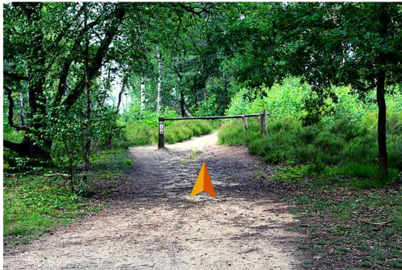
En we gaan verder; de losse zand in, geniet van de mooie purpere heide.