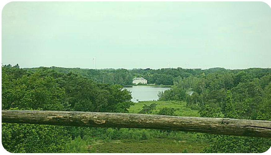
Het kasteel van Terlaemen, Toch een mooi vergezicht met enkele vijvers van De Wijers - Land van 1001 vijvers.